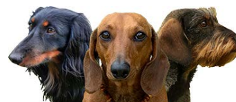
Dackel Ostschweiz RG im Schweizerischen Dachshund-Club